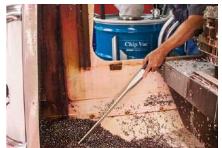
El Chip Vac de 410lts, ofrece una capacidad de limpieza máxima en muy poco tiempo para grandes operaciones de mecanizado