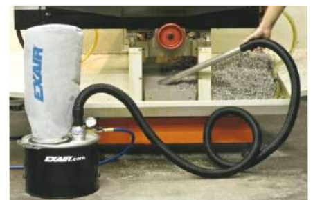
El Chip Vac Mini posee el mismo poder de limpieza que el Chip Vac y su tamaño lo vuelve ideal para trabajos pequeños